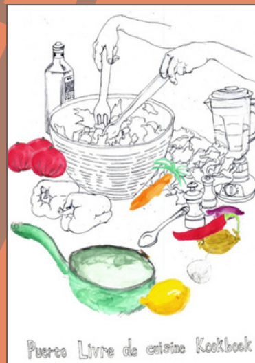
illustration par Yi Jiang

Femke, ton engagement, ta passion et ton goût ont fait toute la différence pendant près de vingt ans. Merci pour tout ce que tu représentes pour Maison de la Paix. Nous vous souhaitons encore de nombreuses années savoureuses !